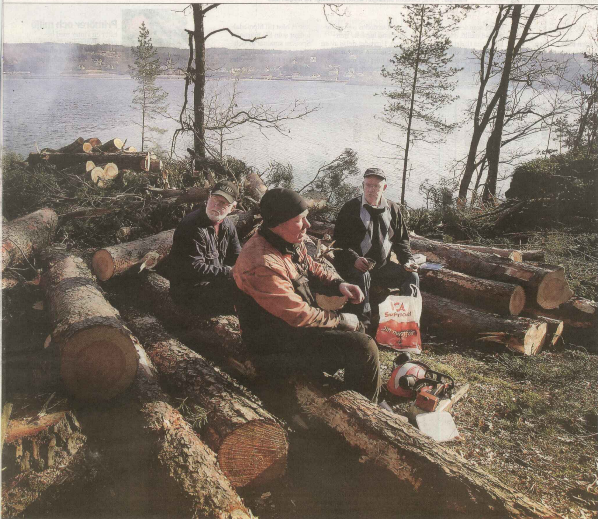
bulle och limpsmörgås. Till lunch ska de grilla Bockwurst och vitlökskorv när de ändå har en brasa igång.